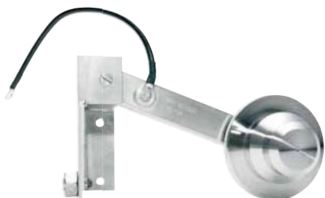
Κυλινδρική γείωση άξονα για Προστασία και την Γείωση από τους Κεραυνούς