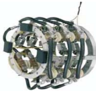
Ειδική Ψηκτροφορείς για γεννήτριες 3,4 MW με ακτινωτούς φυσητήρες