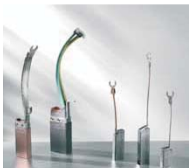
Ψήκτρες για Αντικεραυνική Προστασία