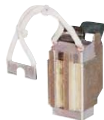
Ψήκτρες ψηκτροθήκες για Αντικεραυνική Προστασία