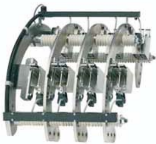
Ψηκτροφορείς προσαρμοσμένοι στο σχεδιασμό για τις γεννήτριες