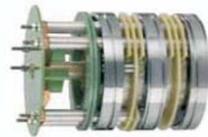
Δακτυλίδια Ολίσθησης μέχρι 1.500 A και πάνω από 3.000 rpm υπερβολικής ταχύτητας